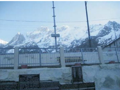
કેદારનાથ મંદિરનો પાછળનો ભાગ