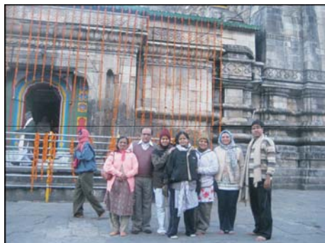
કેદારનાથ મંદિર આગળ સાધકો